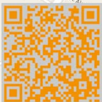
Exposiciones en Google Maps